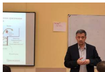
Внедрение интерактивных технологий в образовательную и воспитательную деятельность стр. 8-9