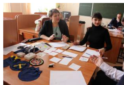
Профориентационная игра «ПроФLAND» стр. 3-4