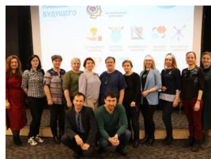
Методики и практики развития эмоционального интеллекта детей и подростков. Формирование навыков будущего стр. 12-13