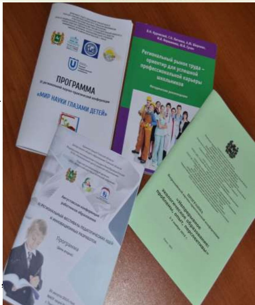
Сборники опубликованных работ