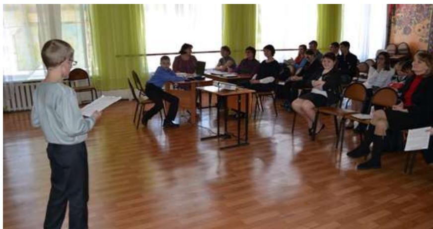
Защита исследовательских проектов