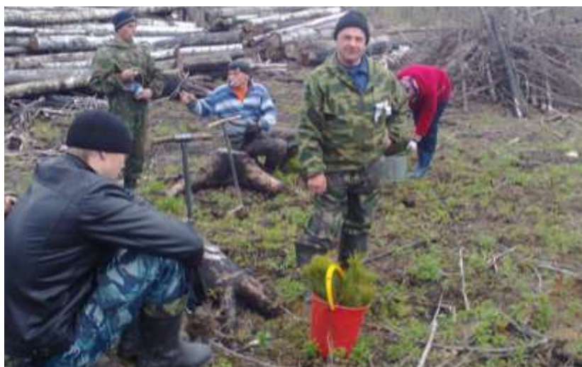
Акция «Лес Победы»