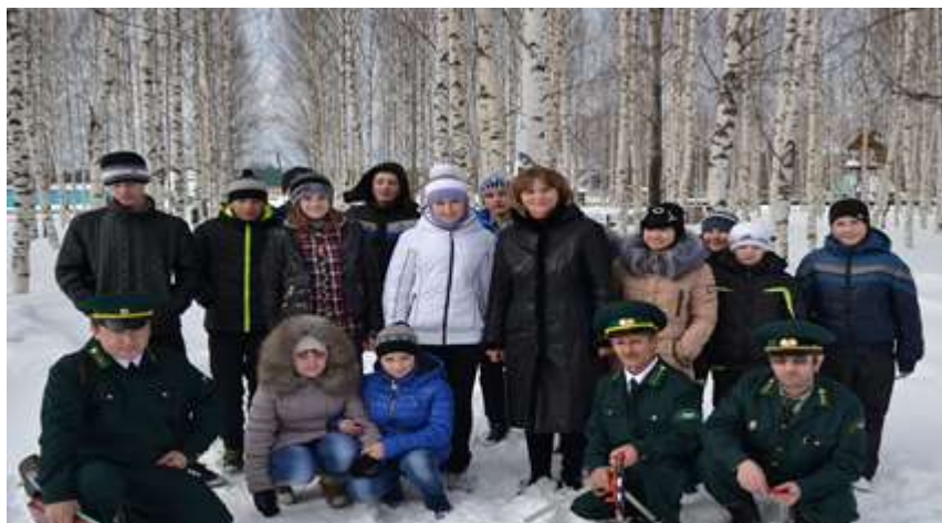
Экскурсия в Улу-Юльский лесхоз