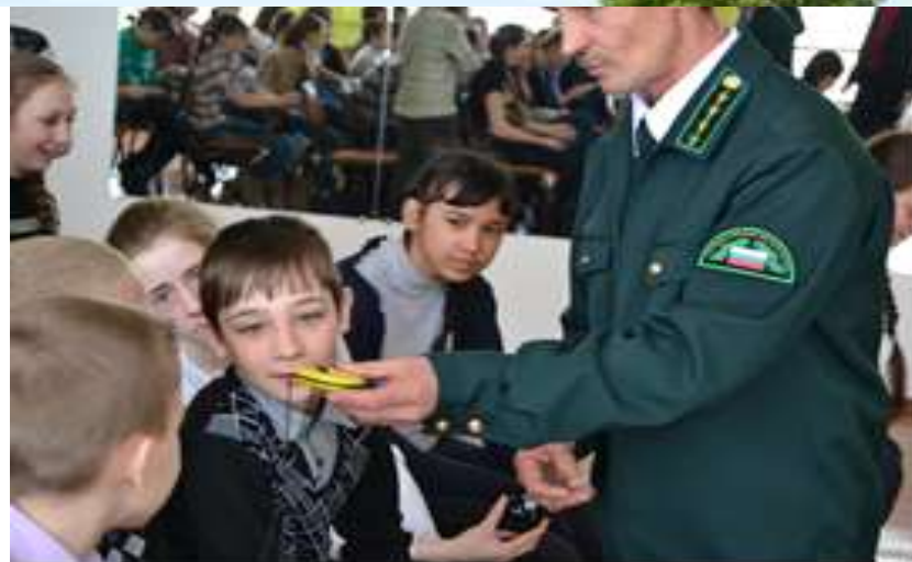
Тесное сотрудничество с работниками лесхоза