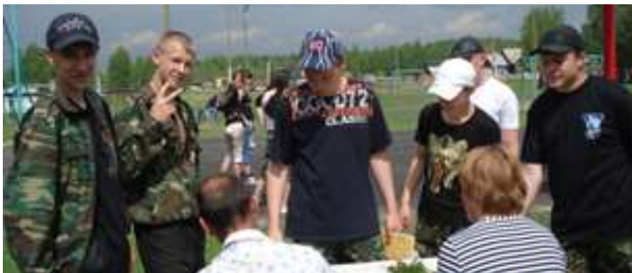
Муниципальный конкурс «Юный лесовод»