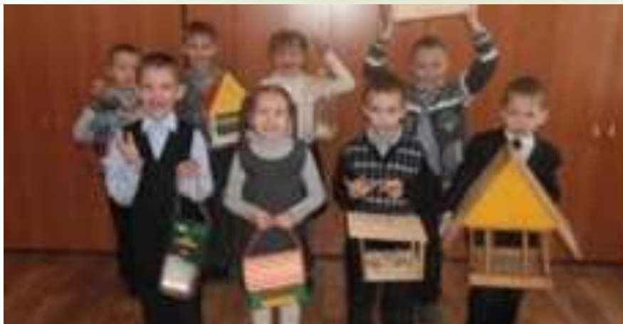
Акция «Подкормите птиц зимой»