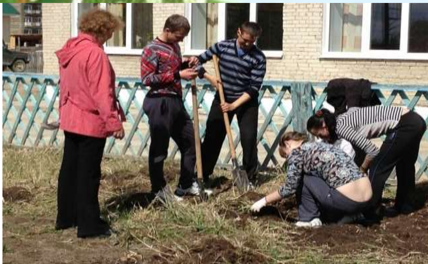
Работа на приусадебном участке. Посадка деревьев