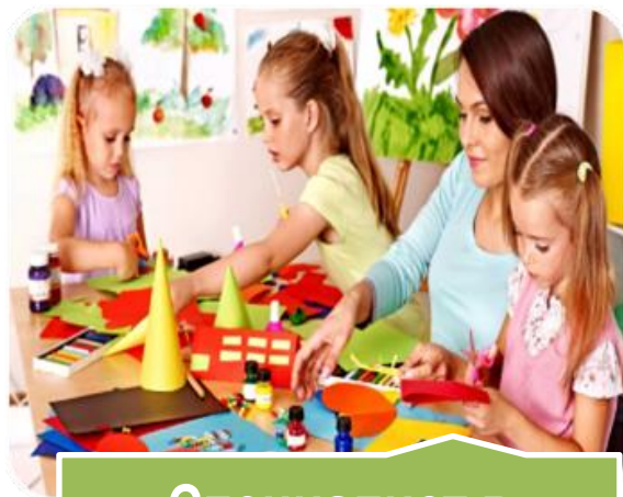
Специалист в области воспитания